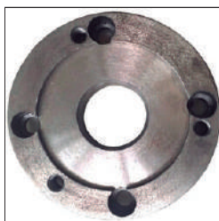
Brida para el plato de 4 garras Ref:30111005B