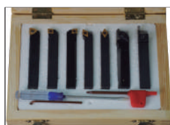
Jgo. 7 htas. mango 10x10 Ref:1010115