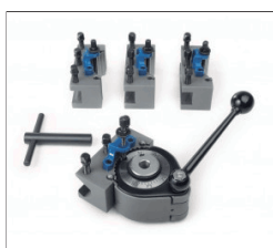
Jgo. Portahtas. Multifix TOOAA.