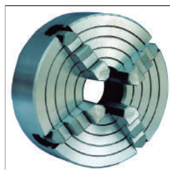
Plato de 4 garras independientes Ref:22014103