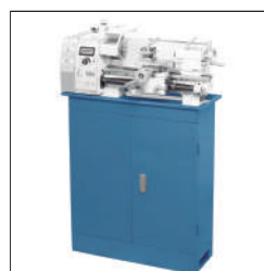
Banco armario Ref:30111030