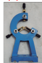
Luneta fija Ref: