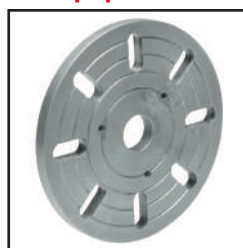
Plato liso Ref: