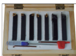
Jgo. 7 htas. mango 12x12 Ref:21010017