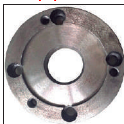
Brida para el plato de 4 garras Ref: