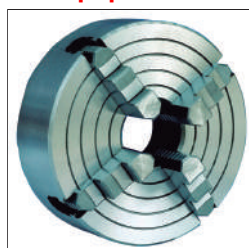
Plato de 4 garras independientes \varnothing 160mm Ref: