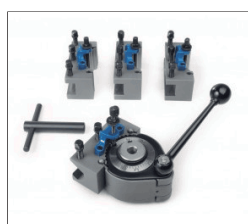
Jgo. Portahtas. Multifix TOO1. Ref: 2212100113