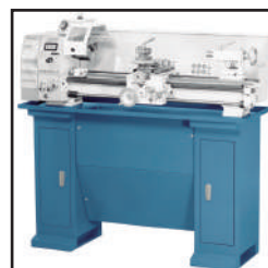
Banco armario Ref: