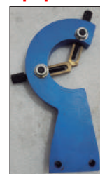
Luneta móvil Ref: